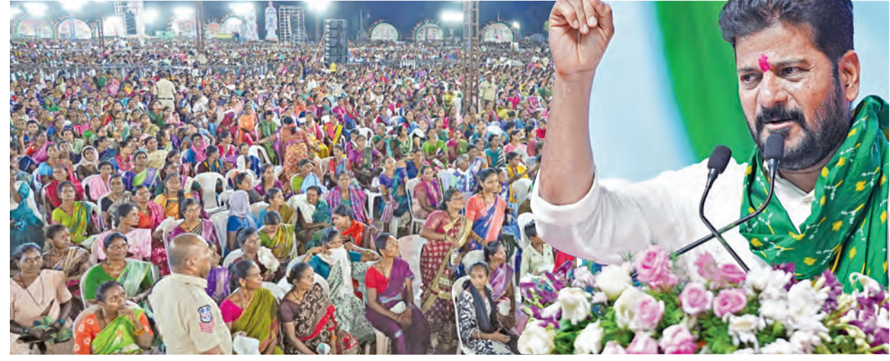
సోమవారం కాంగ్రెస్ నగర్ ఎక్స్ ప్రెస్ బహిరంగ సభకు హాజరైన ప్రజలు సభలో ప్రసంగిస్తున్న సిఎం రేవంత్

ఇందిరమ్మ ఇళ్లు నిర్మిస్తాం కొలాం కొటాలి నుండి సామాహికంగా ఇందిరమ్మ గృహ ప్రవేశం ఆరంభం కొత్తగా రెండున్నర లక్షల ఇళ్లు మంజూరు ప్రతి గింజను కొంటాం, ఆందోళన వద్దు కాంగ్రెస్ నగర్ ఎక్స్ ప్రెస్ బహిరంగ సభలో సిఎం రేవంత్