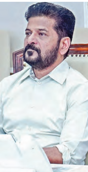
అదేశించారు. ఈ వర్షాలలో ఎక్కడైనా ద్వారా విషయంలో ఇబ్బందులు తలెత్తితే అధికారులకు ప్రతి వర్షాలు తీసుకుంటామని ముఖ్యమంత్రి రేవంత్ రెడ్డి హెచ్చరించారు. వాతావరణ శాఖ అంచనాలు, నివేదికల ఆధారంగా పంటల సాగుపై నిర్ణయాలు తీసుకోవాలని వ్యవసాయ శాఖ అధికారులను >>7

మళ్లించాలనే దానిపై సుష్టమైన విధానం రూపొందించాలని సీఎం రేవంత్ పేర్కొన్నారు. ఉమ్మడి రాష్ట్రంగా ఉన్నప్పుడు నిర్మించిన సీలేరు, తుంగభద్ర ద్వారా నుంచి ఉత్పత్తి అవుతున్న విద్యుత్తులో తెలంగాణకు రావాల్సిన వాటాపై నివేదిక రూపొందించాలని విద్యుత్ శాఖ అధికారులను సీఎం రేవంత్ ఆదేశించారు. రాష్ట్రంలోని అన్ని ద్వారా గేట్ల మరమ్మత్తులు యుద్ధప్రాతిపదికన చేపట్టాలని సీఎం రేవంత్ ఆదేశించారు. ద్వారా మెయింటెనెన్స్ పై ముఖ్యమంత్రి ఎ.రేవంత్ రెడ్డి అధికారులను ఆరా తీశారు. గతంలో కడం ప్రాజెక్టులో తలెత్తిన ఇబ్బందులను సీఎం గుర్తు చేశారు. గేట్ల మరమ్మత్తులు, మెయింటెనెన్స్ లకు సంబంధించి ఇప్పటికే రూ.300 కోట్లు విడుదల చేశామని ఆర్థిక శాఖ అధికారులను ముఖ్యమంత్రికి తెలియజేశారు. ఎన్ని నిధులు అవసరమైనా వెంటనే విడుదల చేయాలని సీఎం