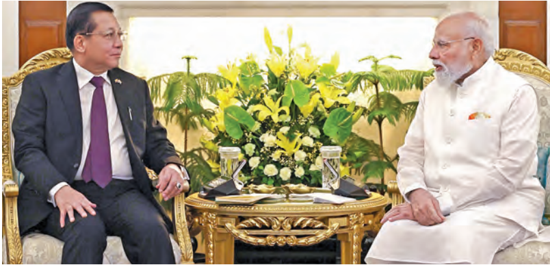
సోమవారం న్యూఢిల్లీలో ప్రధాని మోడీతో భేటీ అయిన ముఖ్యమంత్రి చంద్రబాబు నాయుడు యూ మిన్ ఆంగ్